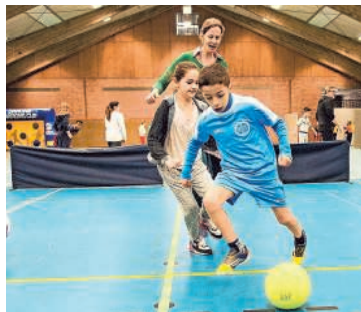
Een jongetje dribbelt met de bal.

deelte van de Nations Cup. 32 ploegen hebben aan de provinciale voorrondes meegedaan. De ploegen bestonden uit acht spelers die allemaal 11 of 12 jaar oud zijn. De Knipoo uit Olen heeft gewonnen en stoot door naar de internationale reeks.» De voetbaltoernooien worden in meer dan 32 landen georganiseerd. Er worden verschillende nationale ploegen gevormd die elkaar zullen ontmoeten in een mythisch stadion voor de internationale finale. De locatie voor 2016 is voorlopig nog niet bekend. De vorige finales waren in Brazilië en Zuid-Afrika. (PJBA)