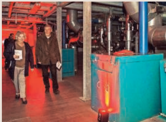
Deelnemers in de technische ruimte van het crematorium. KDS

Het Wilrijkse Crematorium was gisterenavond het decor voor een ongewoon evenement.