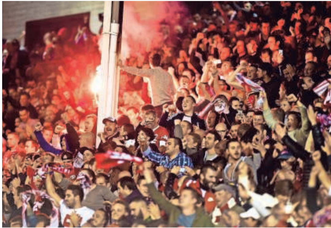
Antwerpfans tijdens de uit-match tegen AFC Tubize op 7 februari. Er waren toen maar 750 plaatsen, maar de 400 resterende Antwerpenaars mochten toch binnen uit vrees voor rellen.

De rood-wit aanhang begrijpt niets van die beslissing. «Heel erg jammer, want in het Jan Breydel-