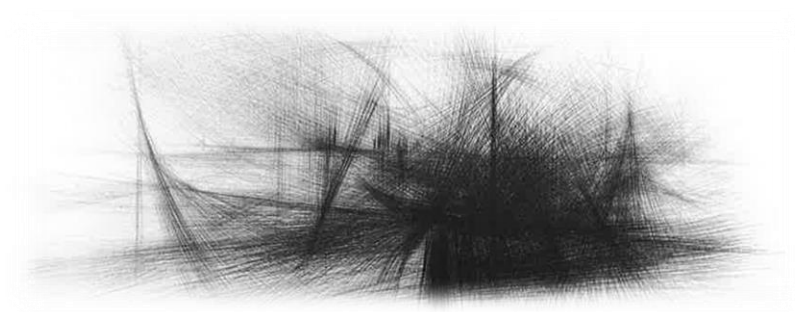
Kleine Haven II, 1966